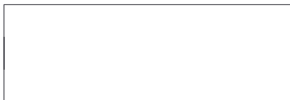
Схема границ эксплуатационной ответственности сторон

Прочие сведения по установлению границ раздела эксплуатационной ответственности сторон _____